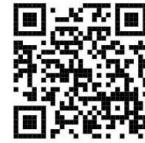
Grävillstånd & TA-planer Bestämmelser och taxa