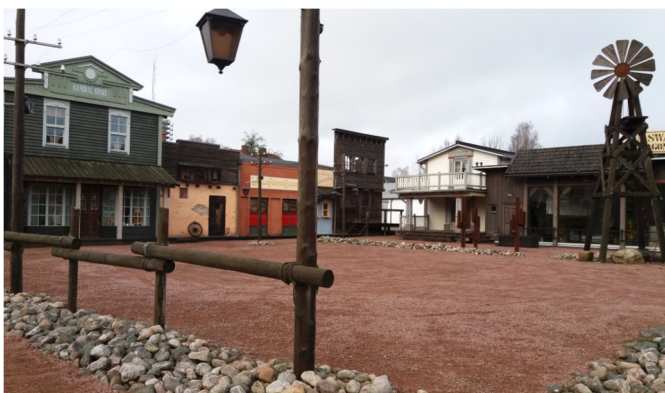
Fort Swanson (11)—Amerikansk westernmiljö / Wild West surroundings / Wildwest-Milieu