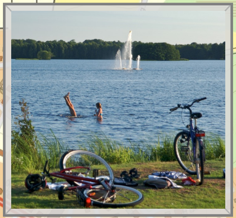
2 Vattenspelet i Osbysjön / The fountain in the lake Osbysjön / Die Fontäne im Osby-See

Fritt fiske/ Free fishing/ Freies Angeln