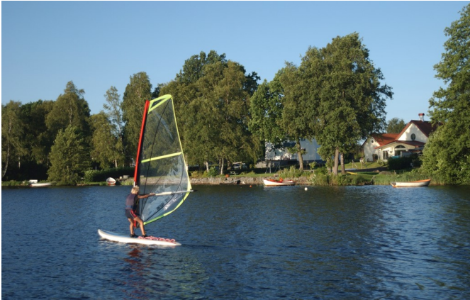
Osbyjön - ein See voller Möglichkeiten