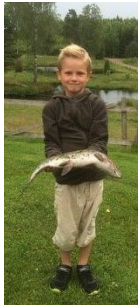
Osbyjön - fishing without a license

The toy tradition is also seen in the colourful and imaginative artworks along the trail. Many children especially like “Ape and Rabbit” or “Tree of the Birds”. The big medieval church in Osby is also well worth a visit. It is nearly always open during the day and you are welcome to see its beautiful interior. Allow yourself to take a relaxing “fika” break in a café, which entices with its personal touch. Or why not spread a picnic blanket and enjoy the lake view, while your children are romping around in the water.