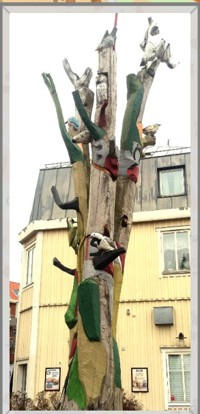
11 Fågelträdet / Tree of the birds / Baum der Vögel