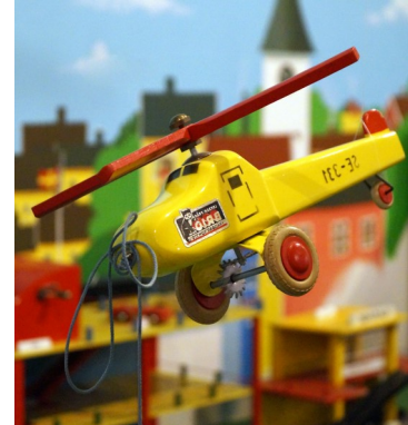
Lekoseum (12) - a museum filled with funny toys

Osby is a typical Swedish small town. It offers you a colourful mixture of green oases, exciting museums and a glistening bathing lake, which almost stretches into the town. Here you are allowed to fish without a license! Unique for big and small is the toy museum Lekoseum.