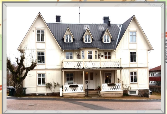
8 Hus från tidigt 1900-tal / House from early 1900s / Haus von Anfang 1900