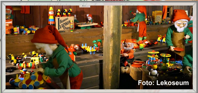
12 Lekoseum: Tomteverkstad / Santa's workshop / Weihnachtsmann-Werkstatt