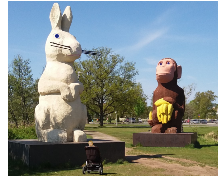
“Apan och Kaninen” (1) på Sjöängen

Den föreslagna slingan börjar och slutar på parkeringsplatsen vid sjön men ni kan anpassa den efter era önskemål. Man tar sig lätt fram på de välskötta vägarna - både till fots och på hjul. Längs huvudvägen finns inga branta upp- eller nedförsbackar men avstickarna kan ha något sämre tillgänglighet.