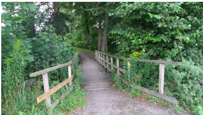
Gröna oaser mitt i byn / Green oases in the middle of the town / Grüne Oasen mitten im Ort